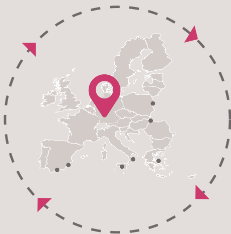
Source: Frontex, arrivées principales des migrants aux frontières extérieures

La relocalisation est le transfert de personnes ayant demandé, ou bénéficiant déjà d'une protection internationale d'un Etat membre de l'Union européenne vers un autre Etat membre qui leur accordera une protection similaire.